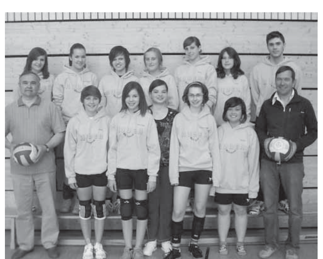
Die U18 der MBB-SG Manching Volleyballabteilung freut sich über ihre neue Sportbekleidung und bedankt sich bei den Sponsoren. Die Aufwärmpullover wurden von der Metzgerei Huber aus Manching (2. Reihe links außen) und die Trainingshosen von der Schreinerei Mayr, ebenfalls aus Manching, (2. Reihe rechts außen) gesponsert.

Die Anmeldung erfolgt über die Geschäftsstelle der MBB SG