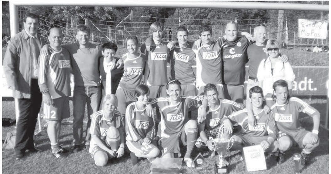
Sieger der Marktmeisterschaft im Fußball 2009 die Mannschaft von Manschlucktso.

Das Mammut-Turnier wurde auf zwei Kleinspielfeldplätzen auf dem Sportgelände des SV ausgetragen. Die zahlreichen Fans konnten dabei in 55 Spielen insgesamt 127 Tore bejubeln.