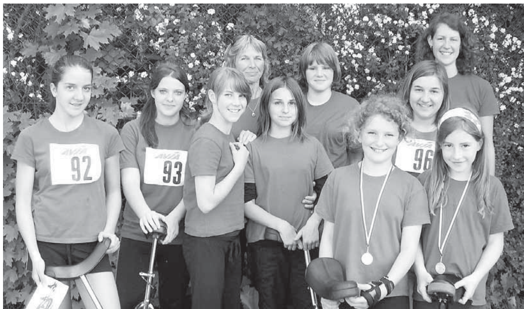
Die Teilnehmer aus Manching bei der Oberbayerischen Meisterschaft im Einradrennen.

Im Gegensatz zu diesen beiden Geschwindigkeitswettbewerben gab es auch noch die Disziplinen „Langsam vorwärts“ und „Langsam rückwärts“. Hier mussten die Einradfahrerinnen auf einem 15 cm breiten Fahrbrett eine