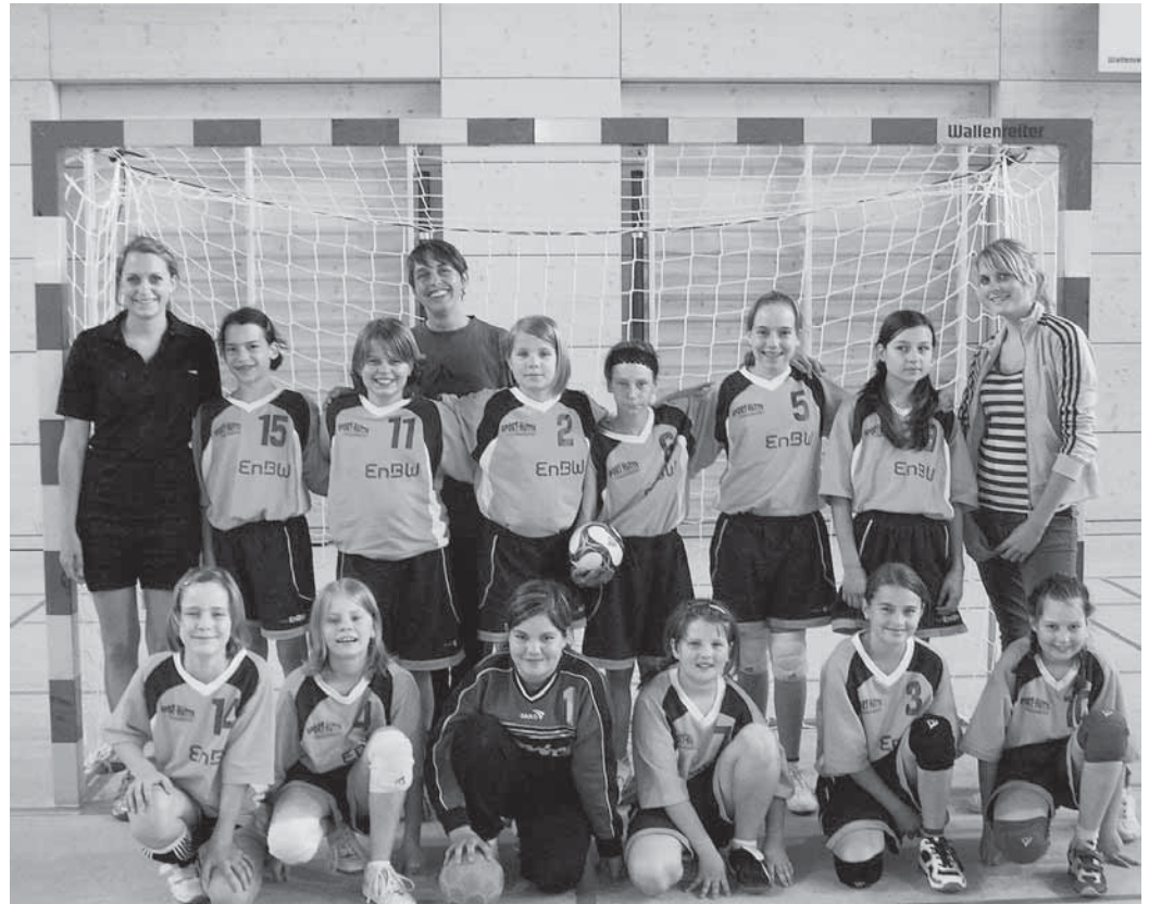
Weibliche D-Jugend der MBB SG Manching mit Trainerstab.

Nach einer souveränen ungeschlagenen Qualifikation darf man sehr gespannt sein, wie sich die weibliche B-Ju-