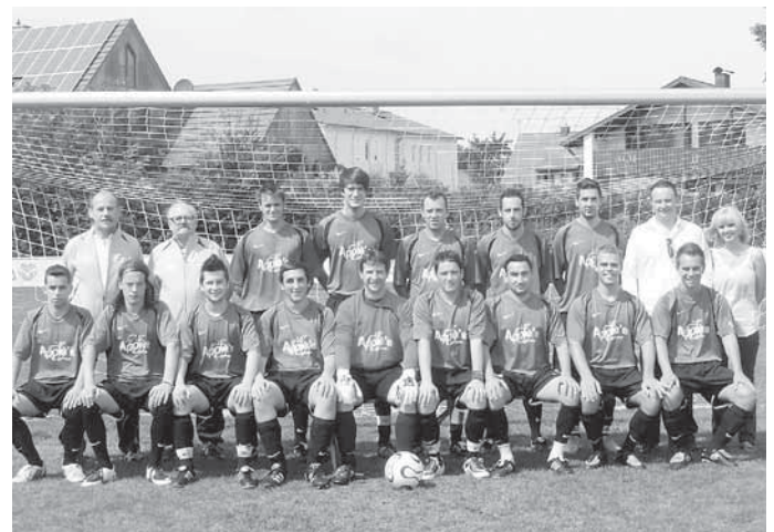
Meister in der B-Klasse und Aufsteiger in die A-Klasse: die zweite Mannschaft des SV Manching!

Den Höhepunkt stellt gleich das erste Testspiel dar. Am 1. Juli gastiert um 18.30 Uhr Zweitliga-absteiger FC Ingolstadt beim SV Manching!