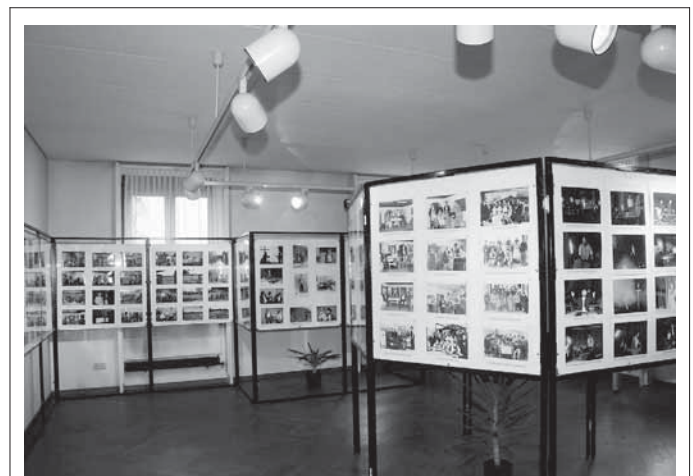
Die Ausstellung über Gump und Gänswürger im Bürgerhaus/Rathaus ist täglich, außer Montag, von 10 bis 17 Uhr geöffnet.

Das Team der Nachbarschaftshilfe wünscht schöne Ferien!