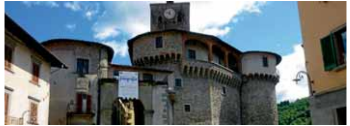
Typisch italienisches Flair erwartet die Besucher.

tos sollen Ihnen ein paar italienisch-sonnige Einblicke ermöglichen. Die Präsentation „Der Markt Manching stellt vor: CASTELNUOVO DI GARFAGNANA – unsere künftig mögliche Partnerstadt“ finden Sie im Internet auf der Homepage des Marktes Manching (Titelseite) unter www.markt-manching.de