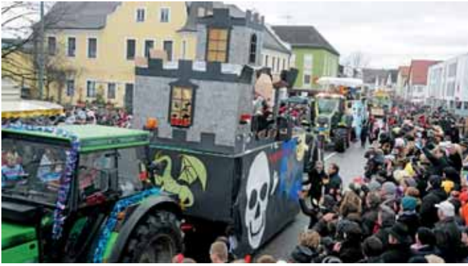
Zahlreiche Gaudiwagen und Fußgruppen zogen am Faschingssonntag durch Manching.