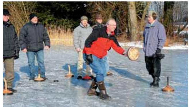
Den zugefrorenen Weiher in Westenhausen nutzen die Eisstockschützen trotz bitterer Kälte am Sonntagnachmittag, um ihrem Sport zu frönen. „Bei soviel Spaß vergisst man schon einmal die klirrende Kälte“, so ein Freizeitsportler, „wenn es dennoch zu kalt wird, haben wir warme Getränke dabei“.