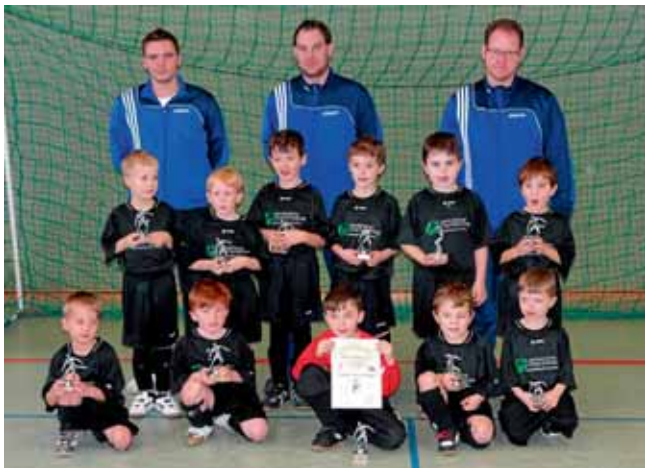
Die G-Jugend belegte beim Jugend-Hallenturnier des SV Grasheim den 8. Platz.