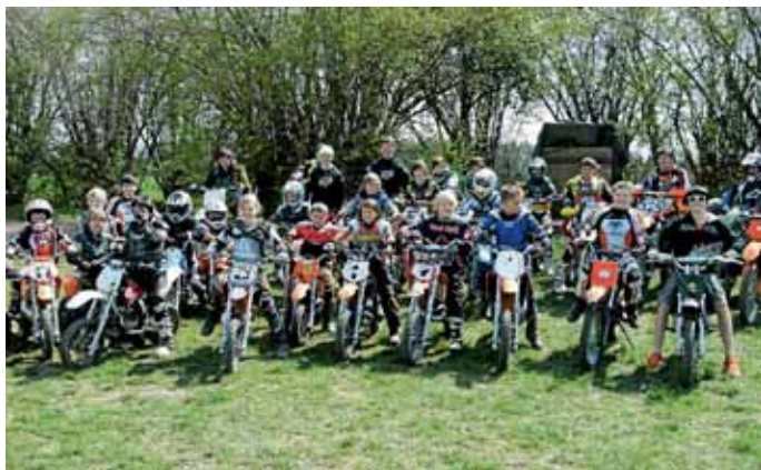
Mit viel Spaß bei der Sache: die jungen Motocrosser des MSC Manching. Karin Hoppe