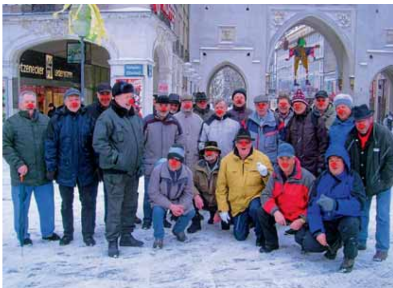
Eine fröhliche Runde der Hatschwanderer bei Schneegestöber zum Verkehrszentrum Deutsches Museum in München.

Da die Zeit nicht stehen bleibt, wurde bereits im Februar in der Faschingszeit (siehe Bild) ein Abstecher nach München zum Verkehrszentrum Deutsches Museum mit Besichtigung unternommen. Hatschwanderer Manching