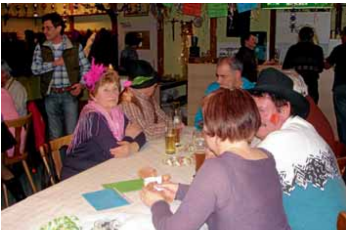
In geselliger Runde Fasching gefeiert.