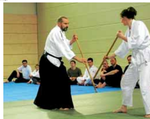
Aikido-Gruppe der MBB SG Manching in der Realschule am Keltenswall.