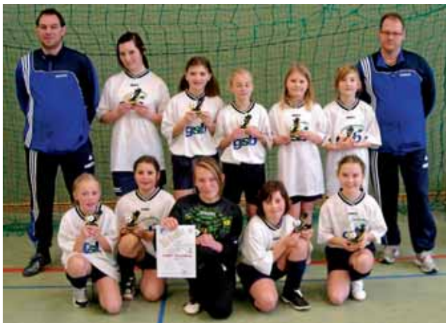
Ebenfalls den 8. Platz belegte die Mädchenmannschaft.