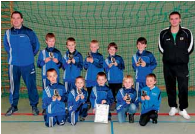
Die F-Jugend belegte den 10. Platz.