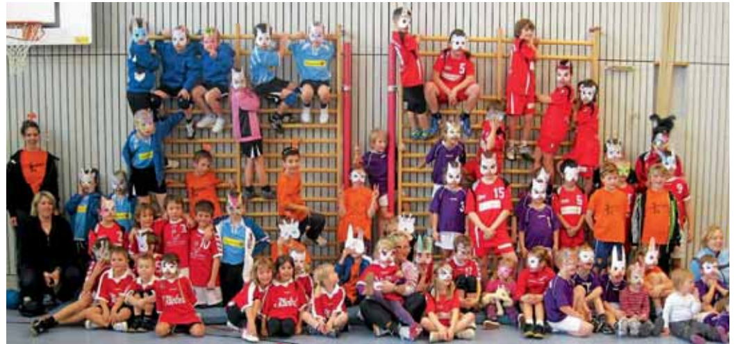
Handball-Spielefest in der Mehrzweckhalle Lindenkreuz.

Der Förderung der körperlichen Gesundheit und Leistungsfähigkeit kommt in den letzten Jahren eine besondere Bedeutung zu, gerade auch in vorschulischen Einrichtungen. Auf Initiative der Übungsleiterinnen der MBB SG Manching, Abteilung Handball, wurde dem Kindergarten „Stieglitznest“ in Man-