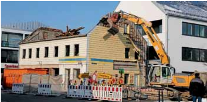
Mit dem Abriss der alten Eisdiele entsteht Raum für den neuen Ortskern.

Paarbrücke, Kirchenkramer mit dem Missionskreuz, Jungbräu, Bräujackl und Riesenwirt rundeten den Ortsmittelpunkt ab, durch den sich eine staubige Straße zog. Um das Regenwasser abzuleiten, waren beiderseits tiefe Wassergräben vorhanden. Dieser Bereich der Ingolstädter Straße wird sich in den nächsten Jahren im Rahmen der Gemeindeentwicklung erneut verändern. Die Planungen laufen auf Hochtouren. Max Schmidtnr / OsP