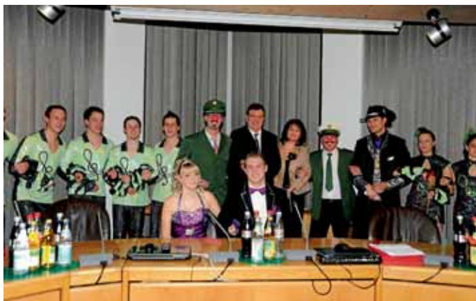
Manchings Rathausspitze wurde durch das Manschuko-Prinzenpaar und die Ordnungshüter verhaftet. Max Schmidtnr

Wirtschaft und verkündeten unter trauerndem Geheul die letzten Stunden an, die am Aschermittwoch endeten. Nach dem feurigen Spektakel auf der Brücke, das rund 1000 Zuschauer verfolgten, steuerten die Faschingsmacher den Manching Hof an, um dort noch einmal das gesamte Programm einschließlich der Jugendtanzgruppen in Trauerkleidung vorzuführen. Wenn auch zum Abschluss bei einigen Akteuren leicht Tränen flossen, freuen sich viele wieder, wenn es heißt „Auf geht's bei Manschuko“. Max Schmidtnr