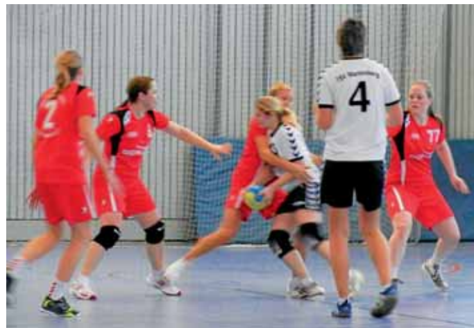
Spielezene aus dem Treffen der Handballerinnen (rotes Trikot) gegen Wartenberg.