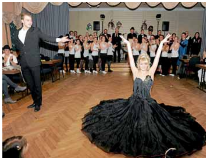
Prinzenpaar in Trauerkleidung beim Abschiedstanz.