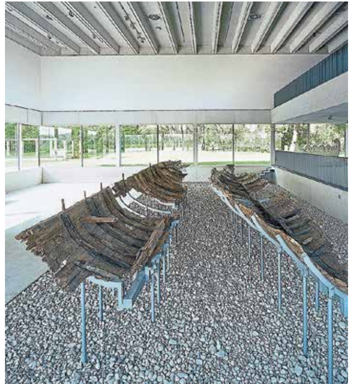
Die Römerschiffe aus Oberstimm im kelten römer museum.