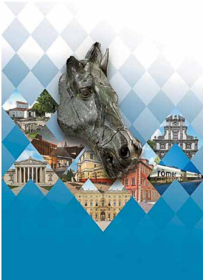
Plakat zur Sonderausstellung „Antike in Bayern“ im kelten römer museum manching.