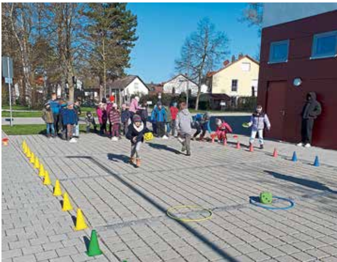
Foto: Staffellauf als Würfelspiel

Wie im letzten Jahr, gab es auch in diesem Jahr wieder zwei 2-Tages Outdoor Ostercamps der Kindersportschule der MBB-SG Manching am MBB-Vereinsheim in Pichl. Trotz frostiger Temperaturen waren beide Camps mit einmal 29 Kindern und einmal 22 Kindern sehr gut besucht. Das diesjährige Thema beim Ostercamp 2023 war am ersten Tag eine „Pokémon-Schnitzeljagd“ bei der Pokémonkarten auf drei unterschiedlichen Spielplätzen gefunden werden mussten. Als Belohnung für die Suche bekam jedes