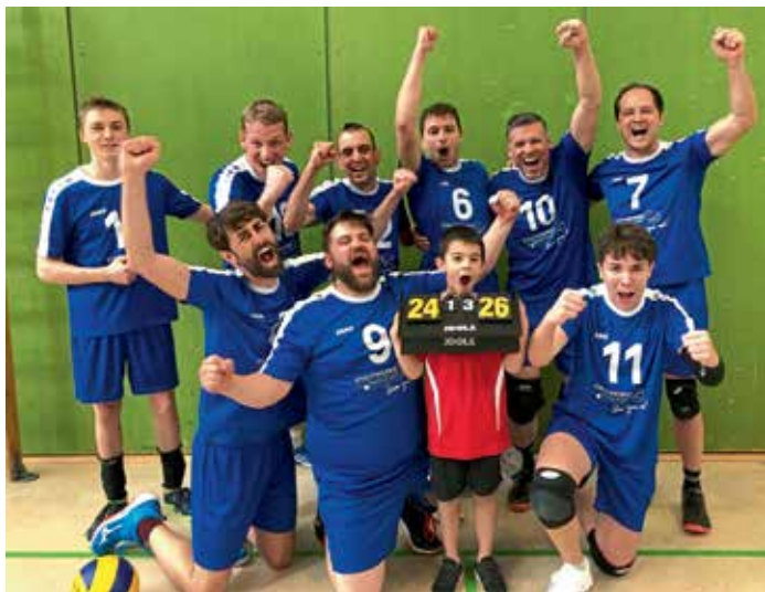
MBB-Herren nach dem Sieg im Relegationsspiel gegen den TuS Fürstenfeldbruck II