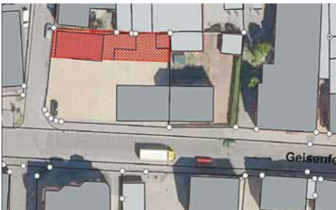
In einer Parkreihe (rot kariert) können Fahrzeuge bis zu 5 Stunden geparkt werden.