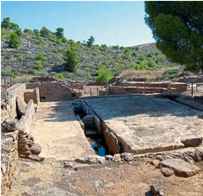
Antike Erzwäsche im Laurion.