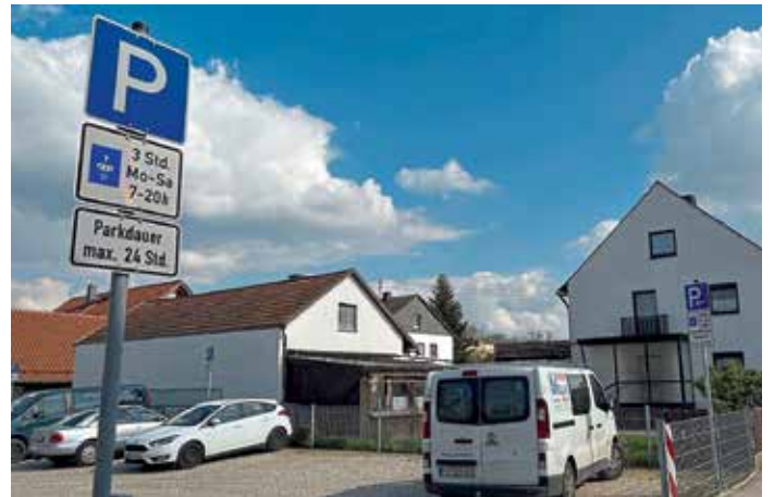
Der Parkplatz an der Ingolstädter Straße/Ecke Mühlstraße steht Montag bis Samstag von 7:00 bis 20:00 Uhr für drei Stunden zur Verfügung.