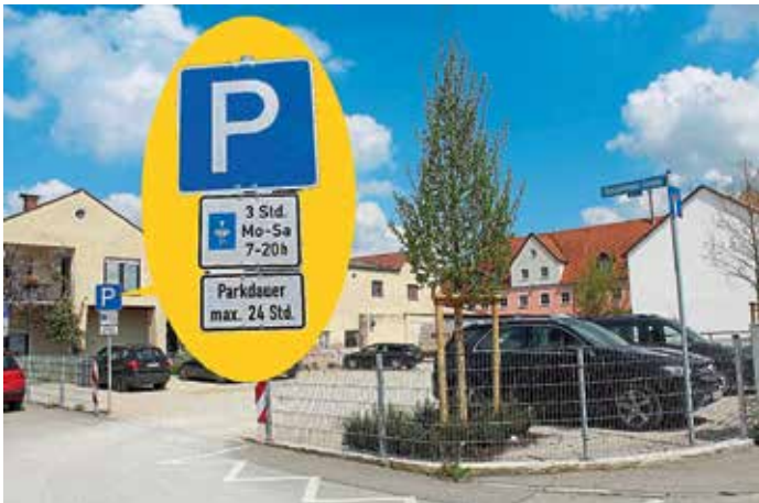
Der Parkplatz an der Geisenfelder Straße steht Montag bis Samstag von 7:00 bis 20:00 Uhr für drei Stunden zur Verfügung.