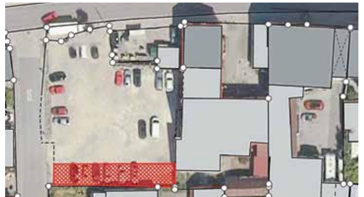
In einer Parkreihe (rot kariert) können Fahrzeuge bis zu 5 Stunden geparkt werden.