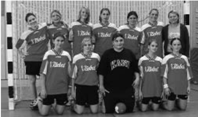
Die erfolgreiche weibliche Handball B-Jugend der MBB SG Manching

Nur noch ein Sieg aus den beiden letzten Heimspielen und den jungen Damen der Handballer der MBB SG Manching ist die Meisterschaft in der Bezirksklasse nicht mehr zu nehmen.