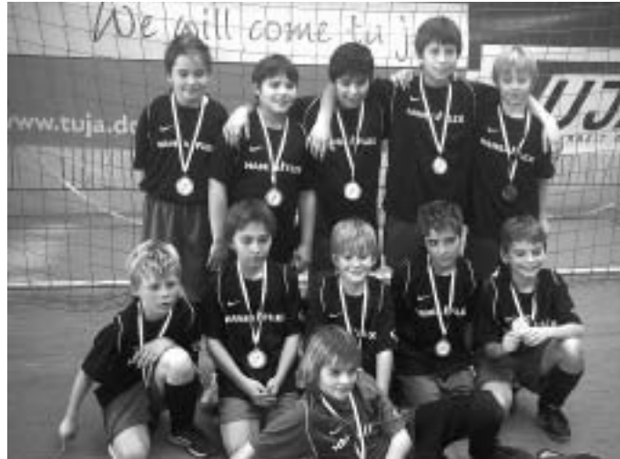
E1- Junioren Vizehallenkreismeister 2006!

Die A- Junioren hatten in der Vorrunde den FC Schweitenkirchen, den SV Stammham und die DJK Ingolstadt als Gegner. Im ersten Spiel gegen den FC Schweitenkirchen wurde den Göppel- Schützlingen ein Fehlpas 10 Sekunden vor Ende zum Verhängnis, den der FC zum 2:1 –Siegtreffer nutzte. Im zweiten Spiel gegen den SV Stammham stand der SV unter Siegzwang, konnte dem Druck standhalten und siegte verdient mit 5:2 Toren. Im letzten Vorrundenspiel gegen die DJK Ingolstadt wäre der Einzug ins Halbfinale durch ei-