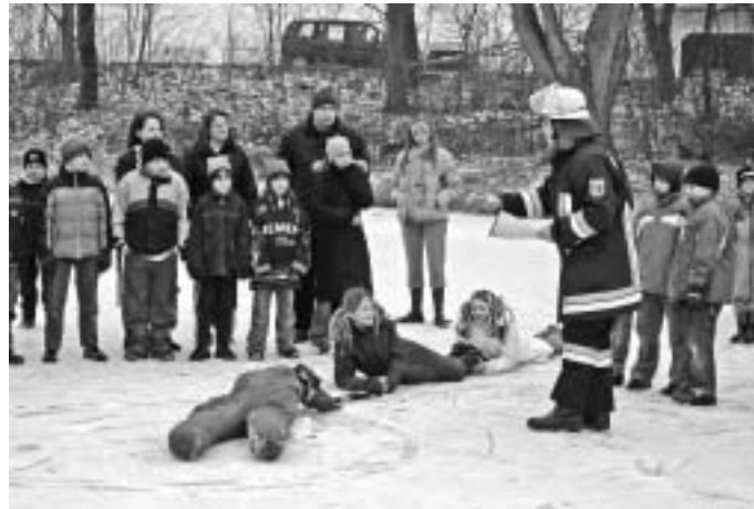
Eindrucksvoll demonstrierte die Manchinger Wasserwacht im Zusammenspiel mit der Westenhausener Feuerwehr eine Eisrettung.

Ist man bereits ins Eis eingebrochen, so der Mann von der Wasserwacht, muss man versuchen Ruhe zu bewahren und sich irgendwie am Eis festzuhalten, damit man nicht unter die Eisfläche gerät. Auf jeden Fall soll laut um Hilfe gerufen werden. Ist keiner in der Nähe, kann man sich, in dem man einen