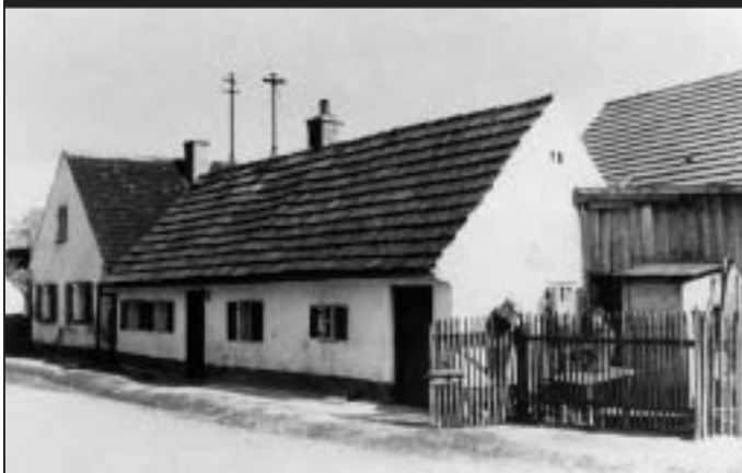
Einst standen an der unbefestigten und staubigen Georg-Mathes Straße, Ecke Mühlstraße die beiden kleinen Fischerhäuser der Familien Metz und Lindner. Schmidtner

Mit dieser Bilderreihe wird der Versuch unternommen, Manchings Vergangenheit wieder lebendig werden zu lassen.