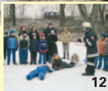
Feuerwehr und Wasserwacht üben den Ernstfall