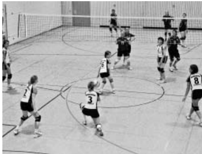
Szenen aus dem Hinspiel der ersten Damenmannschaft gegen den MTV Ingolstadt II