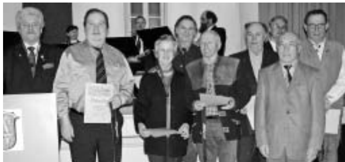
Ehrung für 40-jährige Vereinsmitgliedschaft.