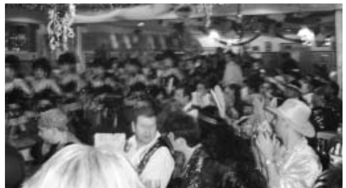
Grün-Weiß-Ball 2006: Bis auf den letzten Platz gefüllt war das Vereinsheim des SV beim diesjährigen Grün-Weiß-Ball.