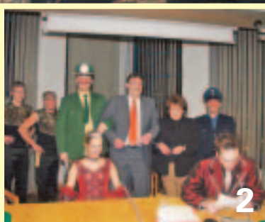
Manschuko überfällt den Manchinger Sitzungssaal