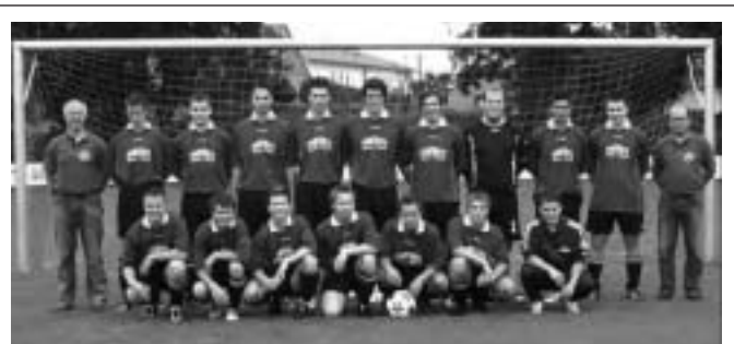
Einen beachtlichen 5. Platz belegten die A- Junioren des SV bei der Hallenkreismeisterschaft 2006

fenhofen, wurde dann sensationell mit 1:0 besiegt. Im letzten Spiel der Vorrunde gegen die DJK Ingolstadt hätte ein Unentschieden genügt, um in das Halbfinale einzuziehen. Doch wieder einmal rächte es sich, dass die Grün- Weißen mit ihrer Chancenverwertung geradezu fahrlässig umgehen. So zogen die Frank- Schützlinge mit 0:2 –Toren den Kürzeren und belegte den undankbaren dritten Platz. Im Spiel um Platz 5 war die JFG Paartal der Gegner. Nach regulärer Spielzeit stand es 1:1- Unentschieden, so dass ein Sieben- Meter- Schießen die Entscheidung bringen mussten. Auch hier zeigten sich die Manching nicht treffsicher genug