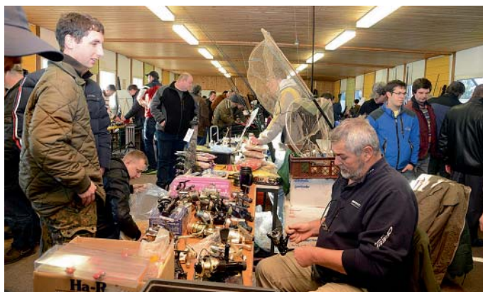
Aus ganz Bayern reisten zum Anglerflohmarkt nach Manching Interessenten an. Max Schmidtnr

Als ideal bezeichnete ein Vater, der seinem Sohn eine Angel samt Zubehör kaufte, den Flohmarkt. Man weiß nicht, wie lange das Interesse des Sprösslings anhält. Wenn er nicht mehr Angeln will, dann habe ich nicht viel Geld ausgegeben. Max Schmidtnr