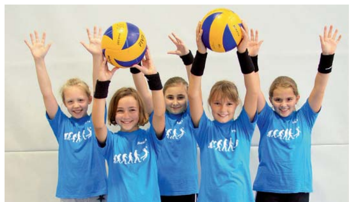
Die F-Jugend-Spielerinnen der MBB-Volleyballer