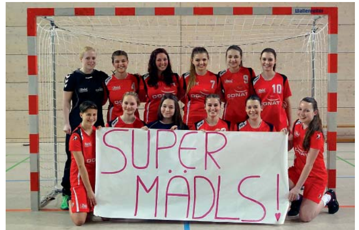
Die Meistermannschaft der MBB-SG Manching