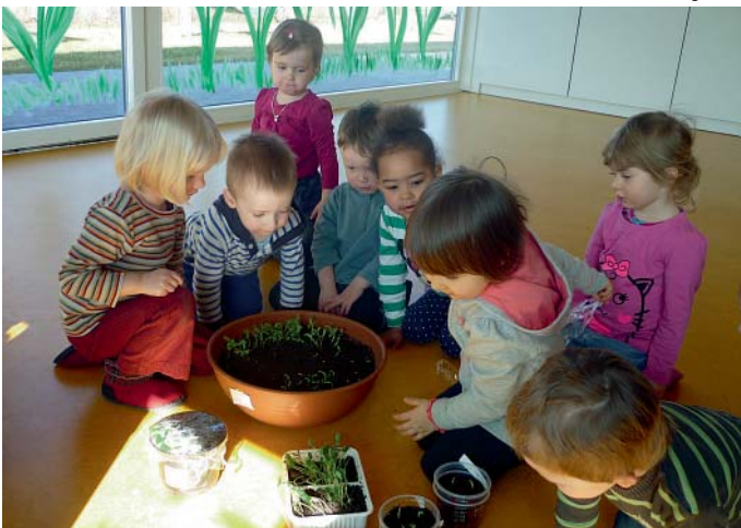
Markt Manching (KöS)

Getreu ihrem Projektthema „Auf m Bauernhof“ wollten die Kinder der Mäusevilla auch als „Selbstversorger“ tätig sein. Vor allem die „Schlaunen Mäuse“ (zukünftige Kindergartenkinder) waren sehr fleißig und säten Gurken, Salat, Bohnen, Zuckererbsen an und bekamen sogar ein paar Tomatenpflänzchen und Saatkartoffeln geschenkt. Voller Spannung werden nun die ersten „Früchte“ zur Ernte erwartet. Doch bis dahin heißt es noch fleißig gießen, düngen und beobachten. In weiteren pädagogischen Aktivitäten wird auch noch die „Kraft“ von Bohnen beobachtet – diese sprengen nämlich sogar Gips! Auf zum Experimentieren!