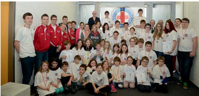
Mit einer Medaille wurden die jungen Rettungsschwimmer beim Kreiswettbewerb in Manching ausgezeichnet.