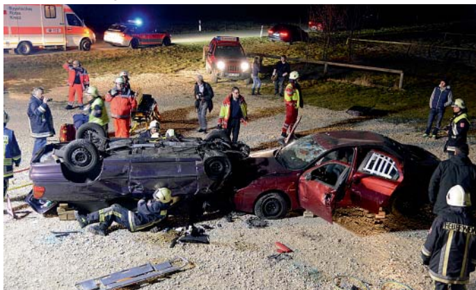
Unter realistischen Bedingungen wurde eine Übung durchgeführt.