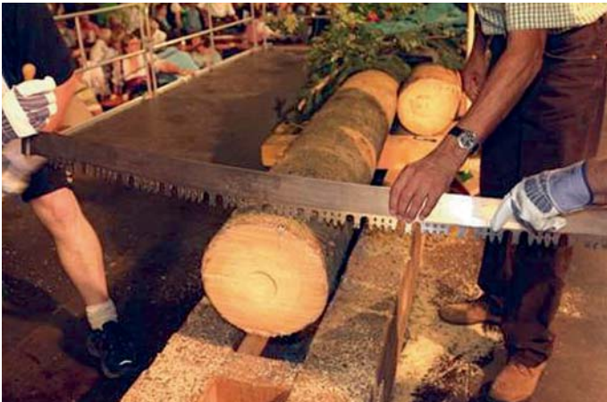
Als letzte Vorbereitung vor dem Wettkampf wird die Zugsäge an die 30 cm starke Fichte angesetzt.