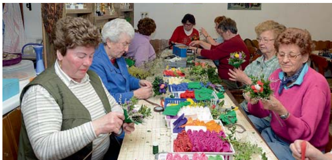
Einen ganzen Tag banden und wickelten die fleißigen Frauen vom Obst- und Gartenbauverein über 220 Palmbüschel für die katholische Kirche, die nach dem Verkauf am Palmsonntag geweiht und nach altem Brauch im Hause aufgehoben werden.

Die erlebten Eindrücke waren überwältigend. osu