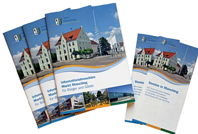
So sieht sie aus, die neue Bürgerbroschüre von Manching samt Vereinseinleger. Markt Manching (GeU)

Um auch der sich verändernden Informationsbeschaffung über Smartphones gerecht zu werden, wird zudem eine Manching-App bereitgestellt, mit der sich mobile Anwender jederzeit über den Markt und seine Angebote informieren können. Diese wird in den nächsten Wochen online gehen. Wir informieren Sie über den Erscheinungstermin. Markt Manching (GeU)