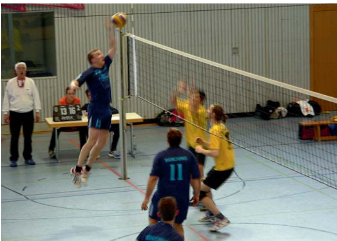
MBB-Herren im Angriff gegen Harteck