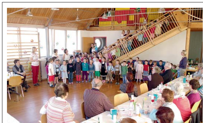
Auf geht's! Unser dem bayrischen Motto: „Mia san Bayern“ feierten die Pichler Senioren ihren diesjährigen Senioren-Vormittag. Die Kinder gestaltet dazu ein kleines Programm. Markt Manching (LeS)