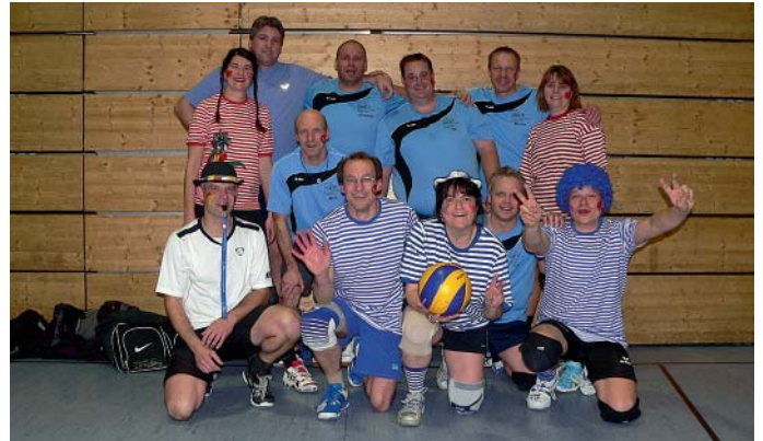
Mixed Manching 2 beim Heimspiel im Fasching am 26. März.