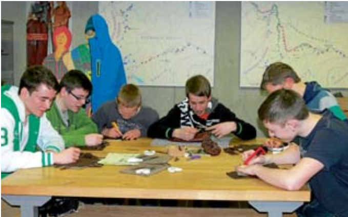
Die Jugendgruppe des Keltisch-Römischen Freundeskreises bei der Arbeit. Johannes Langner

plant sind Exkursionen zu geschichtsträchtigen Orten in der näheren Umgebung. Auch am Museumsfest im Sommer wird die Gruppe anzutreffen sein. Bei Interesse sind wir per E-Mail an info@krfk.de oder jeden Freitag ab 15.30 Uhr im Museum zu erreichen. Johannes Langner