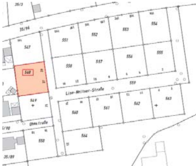
Markt Manching (NeS)