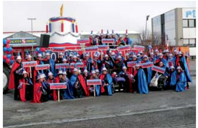
Gruppenbild der Mitglieder der MBB-SG Manching zum Manchinger Faschingsumzug 2013.