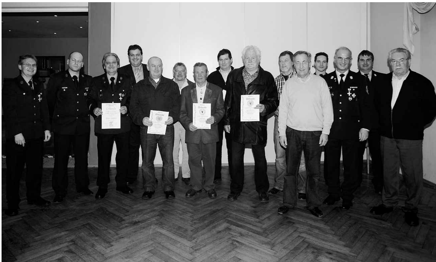
Eine ganze Flut an Ehrungen stand auf der Jahresversammlung der Manchinger Feuerwehr auf dem Programm.