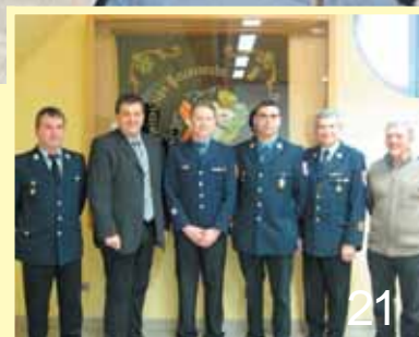
Neuwahl des 2. Kommandanten der Freiwilligen Feuerwehr