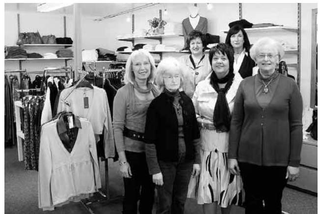
Auf Ihren Besuch freut sich das Team von Mode Hippele

Am 5. März eröffnete das Modohaus Hippele die neu gestalteten Verkaufsräume.