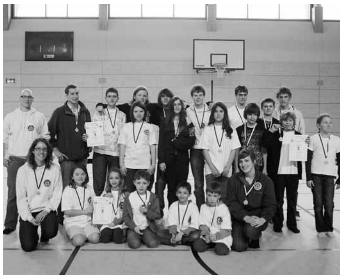
Stolz präsentiert sich die Siegermannschaft beim Gruppenfoto.