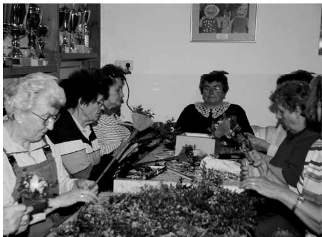
Frauen vom Obst- und Gartenbauverein bastelten für die Pfarrei über 200 Palmbüschel. Der Erlös aus dem Verkauf kommt einem wohltätigen Zweck zugute.