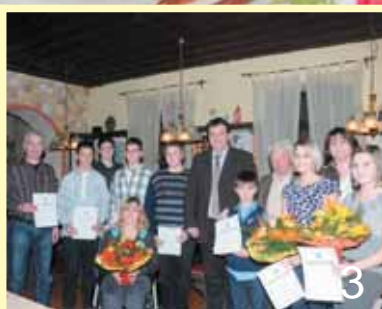
Ehrung verdienter Sportler und Funktionäre

Nach altem Brauch binden die Frauen vom OGV Palmbüsche