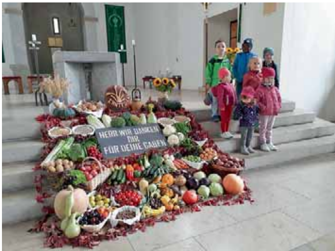
Markt Manching (LoM)

Die Kinder der Fische-Gruppe vom Kindergarten Stieglitznest erarbeiteten eine Woche lang viele verschiedene Punkte zum Thema Nahrungsmittel: