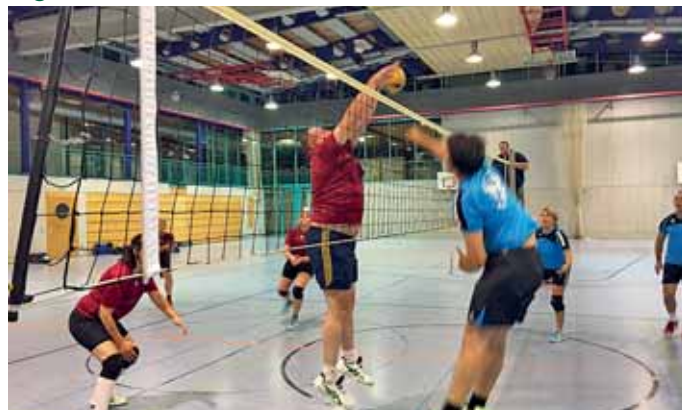
Spielezene aus dem Derby der Freizeitmannschaften Alois Rieder

verloren so den Tiebreak 6:15. Im zweiten Spiel des Tages trafen die Manchinger auf einen altbekannten Gegner: Die DJK Titting, und gegen diese sollte nach langer Zeit endlich mal ein Sieg her. Nur leider klappte es wieder nicht, die MBB-ler konnten nur Satz 2 für sich entscheiden und das umkämpfte Spiel wurde mit 1:3 Sätzen verloren. Zum 2. Spieltag am 14. Oktober mussten die MBB-Herren nach Oberding reisen und verloren dort das Spiel gegen die Heimmannschaft 0:3. Die Manchinger konnten mit den erfahrenen Gegnern zwar mithalten, aber es reichte nicht zu einem Satzgewinn (15:25,13:25,17:25). Im zweiten Spiel traf die MBB-Sechs zum Rückspiel gleich erneut auf den MTV Ingolstadt 3. Das Spiel gestaltete sich von Beginn an für beide Seiten ebenbürtig und so entwickelte sich ein enges Match. Die ersten beiden Sätze gingen jedoch mit 27:25 und 25:21 an die Ingolstädter. Manching holte sich dann die Sätze 3 und 4 (26:24, 25:20). Nur den entscheidenden Satz mussten sie deutlich knapper als in der Vorwoche mit 13:15 abgeben und reisten erneut mit nur einem Punkt ab. Besser machte es die 2. Damenmannschaft, die am 14. Oktober in Schrobenhausen in die Kreisklassensaison startete und als Kreisligaabsteiger der Favoritenrolle gleich mit einem klaren Doppelsieg gerecht wurde. Das erste Saisonspiel gegen den gastgebenden SSV Schrobenhausen wurde 25:14, 25:23 und 25:18 gewonnen. Trainer Gerald Prawda stellte resümierend fest: „Obwohl wir dem Gegner