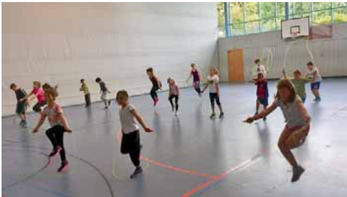
Herzvorsorge, die Schulkindern Spaß macht.