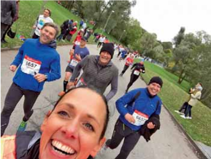
MBB-Tänzer beim München-Marathon