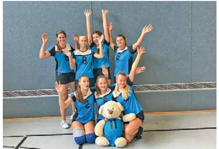
Volleyballerinnen der U18 weiblich der MBB-SG Manching