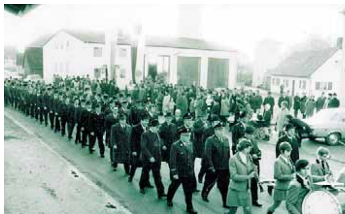
1973 Einweihung des neuen Feuerwehrhauses an der Bergstraße mit Festzug.