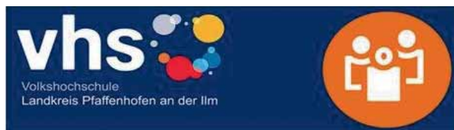
SIMFLH Bayern – Pressestelle

11.10.2017 im Rahmen einer feierlichen Veranstaltung in der Regierung von Oberbayern. Somit ist ein weiterer wichtiger Schritt getan. Mit der Telekom wurde bereits ein Kooperationsvertrag abgeschlossen, die Planungen laufen. In spätestens zwei Jahren ist in Manching flächendeckend schnelles Breitband-Internet verfügbar.