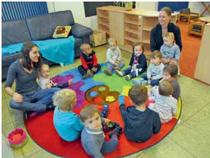
Markt Manching (ApS)

Zusammenrücken hieß es dieses Jahr beim ersten gemeinsamen Elternabend in der Mäusevilla.