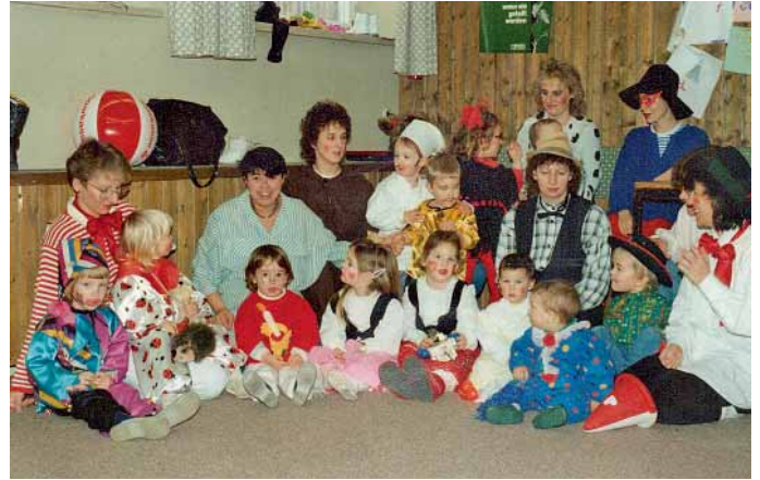
Eine der Mutter-Kind-Gruppen Manching bei einer Faschingsfeier in den Anfangsjahren.