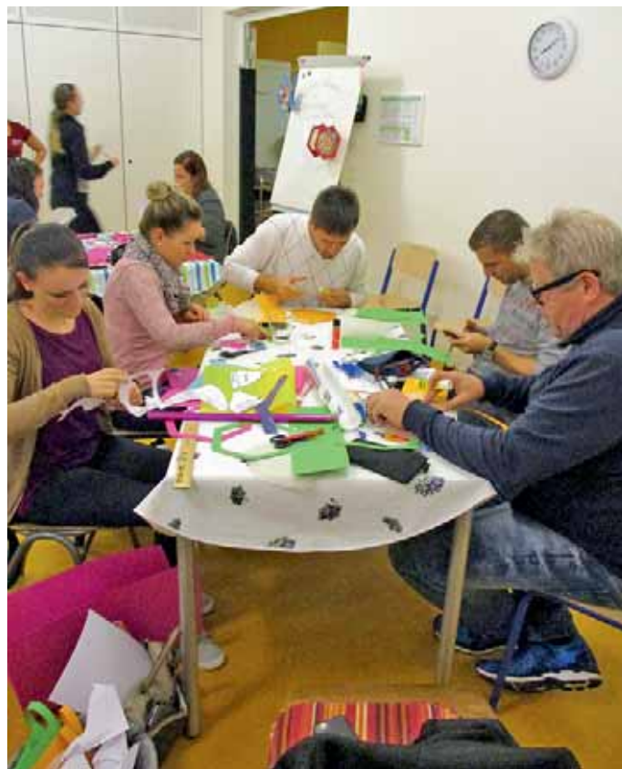
Markt Manching (ApS)

Wir bedanken uns bei allen anwesenden Eltern für diesen kurzweiligen Abend, freuen uns auf ein erfolgreiches Krippenjahr und die Zusammenarbeit mit dem Elternbeirat.