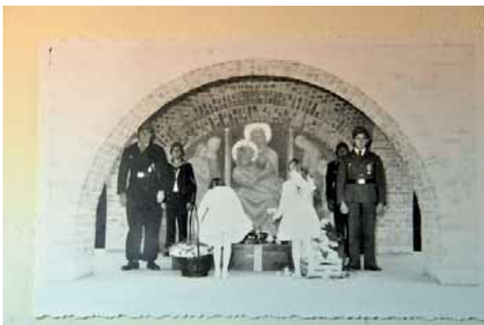
Am 17. November 1957 wurde das Kriegerdenkmal in Manching eingeweiht.