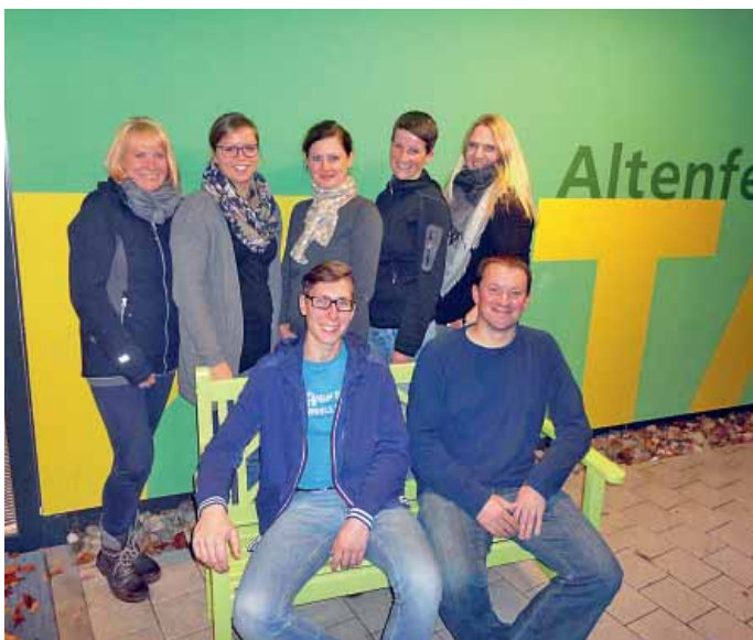
Die Kita Schatzkiste begrüßt ihren neuen Elternbeirat