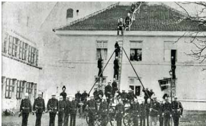
Anno 1893 führte die Manchinger Wehr eine Übung am alten Lehrerhaus, das vor der Kirche stand, mit dem Spritzenwagen und wackeligen Holzleitern durch.