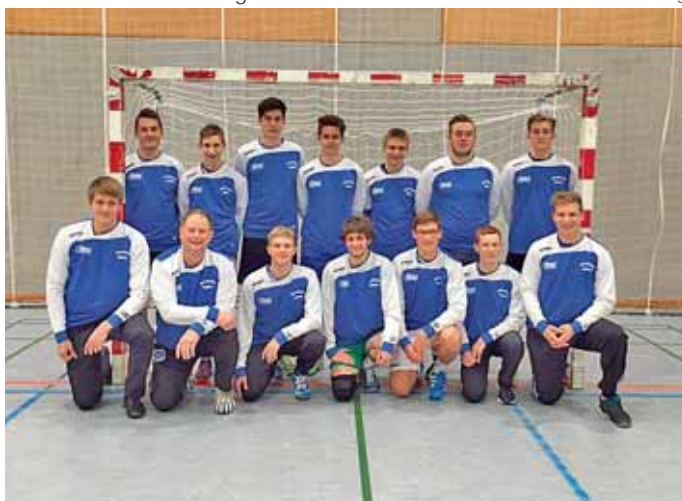
Sechs Spiele, sechs Siege - diese Ausbeute der männlichen A-Jugend in der Bezirksoberliga kann sich sehen lassen.