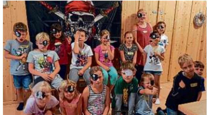
„Ferien-Piraten“ der MBB-SG Manching