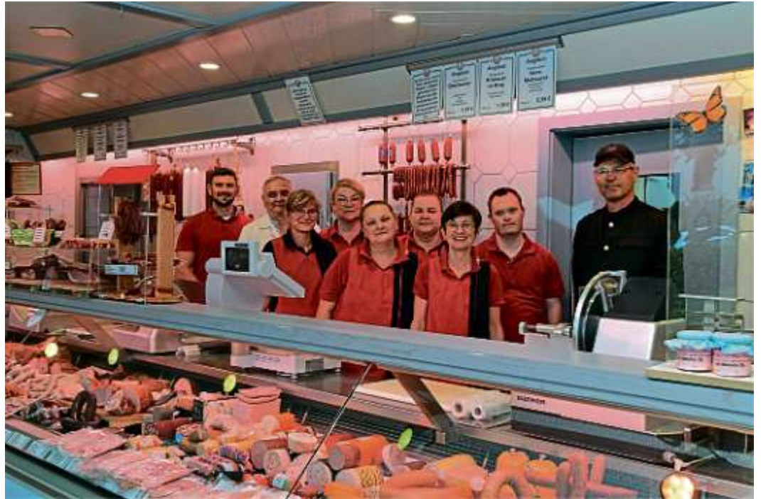
Geschultes Personal steht in der Metzgerei Huber der Kundschaft zu Verfügung.