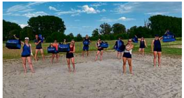
„Hoch die Taschen“ – präsentieren die MBB-Volleyballer*innen die neuen Trainingstaschen