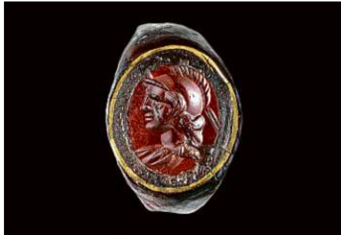
1) Römischer Fingerring (1. Hälfte des 1. Jhs. n. Chr.) aus Eining. Die eingelassene Gemme zeigt die Göttin Minerva mit Helm.

Gemmen gelangten (und gelangen auch heute noch) oft ohne konkrete Herkunftsangaben in öffentliche und private Sammlungen. Damit gehen für die Archäologie wertvolle Informationen meist unwiederbringlich verloren. Die Sonderausstellung in Manching hingegen zeigt Exemplare aus der Archäologi-