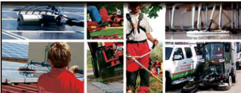
Hausmeisterdienst · Gebäudereinigung · Aufsperrnotdienst · Gartenpflege · Gemeindearbeiten Graffiti-Entfernung und Oberflächenschutz · Schulungen · Photovoltaikanlagenreinigung

*bei schlechtem Wetter: Kirche St. Peter, Manching