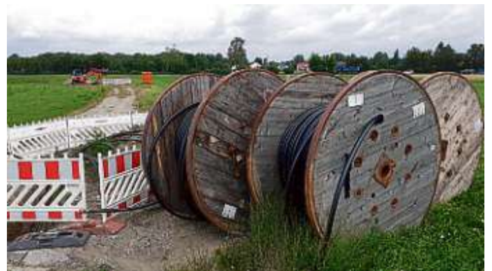
Bauamt Markt Manching (DeJ)

Der Stromnetzbetreiber Bayern- werk verlegt aktuell eine von In- golstadt-Ringsee über Nieder- stimm nach Pichl führende Frei- leitungstrasse neu als Erdkabel. Die neuen 20 Kilovolt-Leitungen sind leistungsfähiger und si- chern die Stromversorgung in Zukunft, gerade in Hinblick zum Beispiel auf E-Mobilität. Bestehende Erdkabeltrassen werden im Zuge der Baumaßnahme