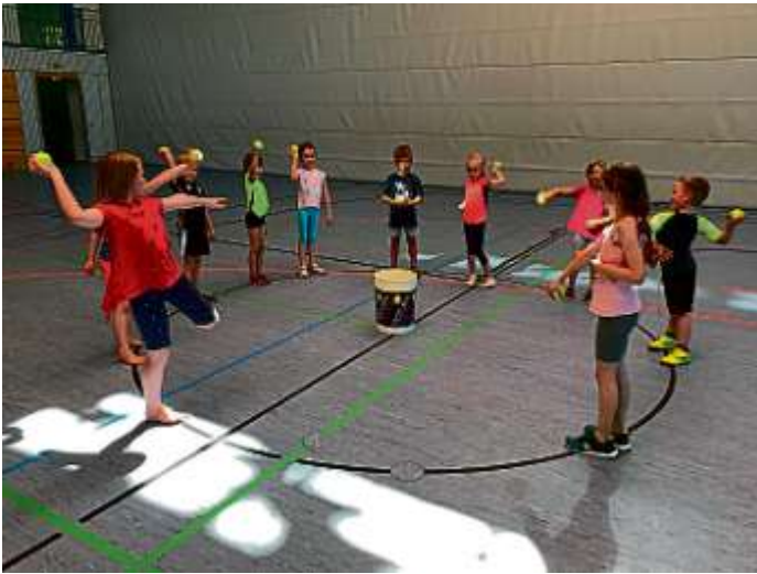
Kinder der „Bewegung Kunterbunt“ wieder in der Sporthalle!

Birgit Prawda / Uwe Girgsdies / Alois Rieder