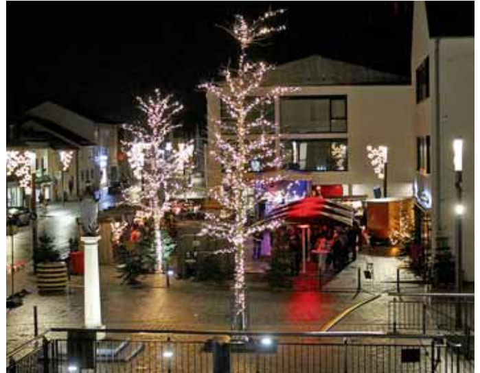
Die Holzhütten, Christbäume und Lichterketten verwandelten das Fontänenfeld bereits zum 5. Mal in den idyllischen Adventsmarkt.