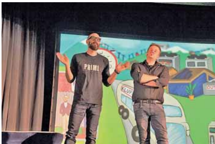
Die Jubiläumstour der beiden Autoren Volker Klüpfel und Michael Kobr aus der Krimireihe Kommissar Klufftinger führte sie nach Manching.