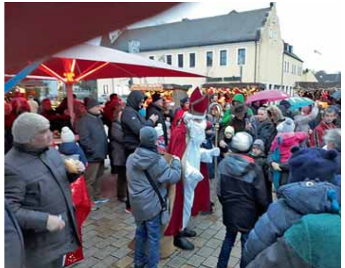
Über 130 Kinder wurden vom Nikolaus mit kleinen Nikolaus-säckchen beschenkt.