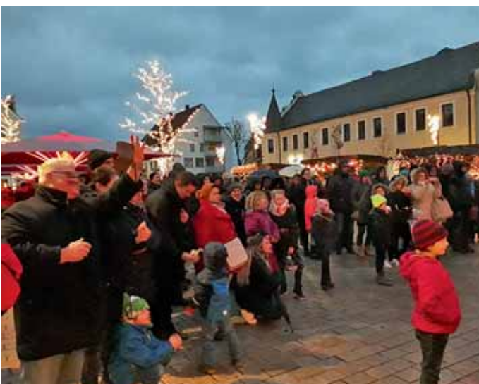
Gespannte Zuhörer beim Auftritt der Chor- und „iPad-Klasse 5d“ der Realschule am Keltenwall.