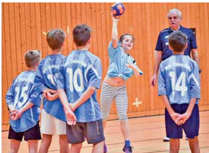
Beim Mixed-Turnier der Ingolstädter Schulen standen Spaß und Fairness im Vordergrund.