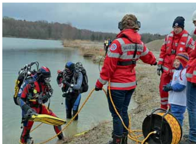
Der Ernstfall muss auch im Winter bei der Wasserwacht geübt und geprobt werden.