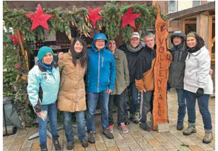
Standaufbau der MBB-Volleyballer im Nieselregen für den 5. Adventsmarkt am Fontänenfeld.