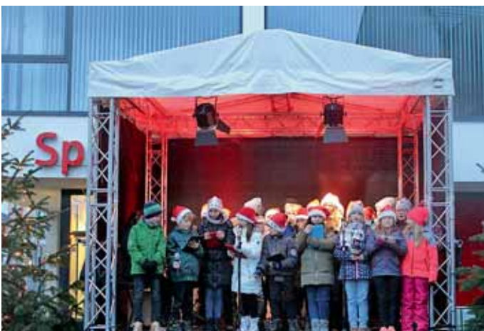
35 Schülerinnen und Schüler der Chor- und „iPad-Klasse 5d“ der Realschule am Kettenwall bei ihrem großen Auftritt.