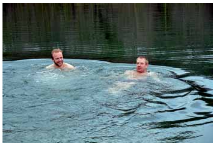
Ohne Schutzanzug in den kalten Fluten schwimmen, ist nicht jedermanns Sache.