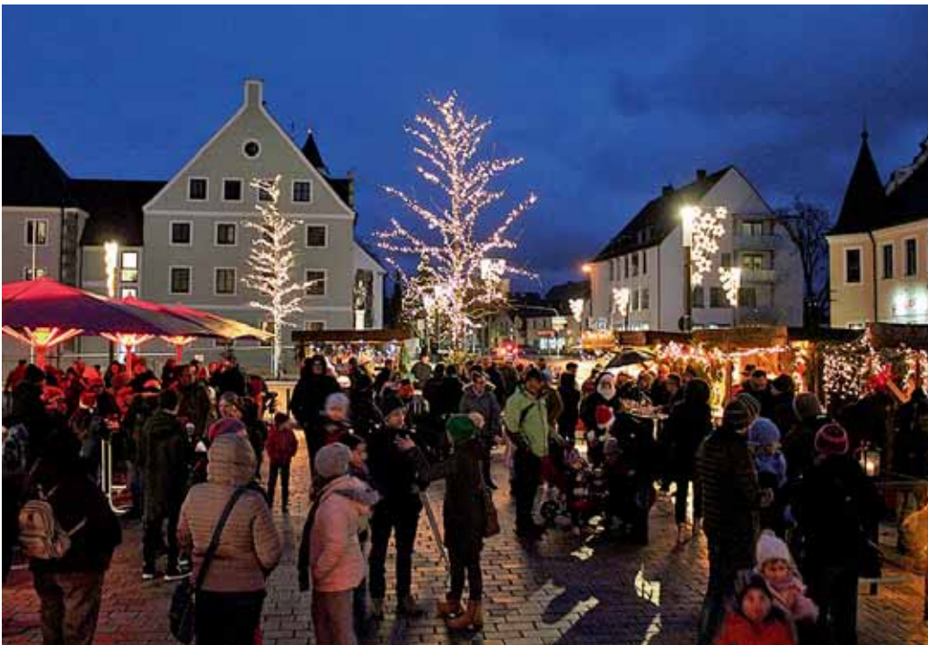
Trotz ungünstiger Wetterverhältnisse kamen am 2. Adventssonntag zahlreiche Manchinger zum Adventsmarkt am Fontänenfeld und verbrachten besinnliche Stunden.