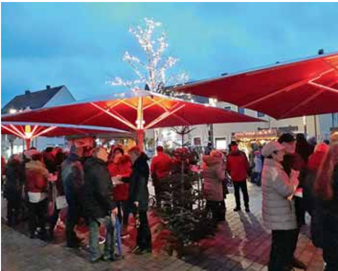
Viele Manchinger nutzten den Adventsmarkt für einen Plausch bei Glühwein und Punsch.