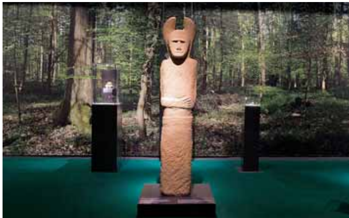
Blick in die Sonderausstellung „Die Bilderwelt der Kelten“