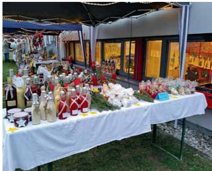
Markt Manching (LoM)

Wochenlang wurde im Kindergarten Stieglitznest gesungen, gebastelt, gebacken und geprobt. Dann, am 7. Dezember 2018, war es endlich so weit. Der Tag der Gartenweihnacht war da! Um 17:00 Uhr warteten alle Eltern, Geschwister, Großeltern und Freunde der Kindergartenkinder gespannt im großen Kreis im Garten.