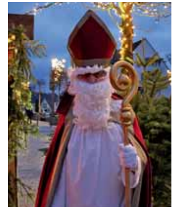
Ein echter Hingucker: Der Nikolaus des Bürgervereins mit seinem purpurroten Bischofsgewand und dem goldenen Stab.

Ein herzlicher Dank gilt allen Mitwirkenden des Adventsmarktes für die großartige Unterstützung! Markt Manching (GrB)