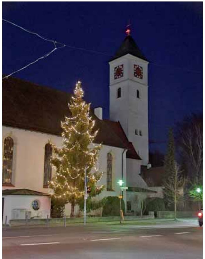
Der durch den Markt Manching beleuchtete Christbaum von St. Peter.