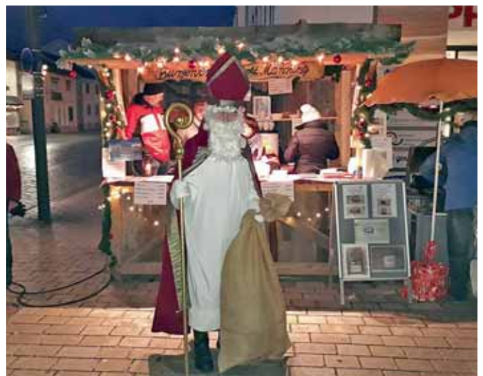
Der Nikolaus des Bürgervereins Markt Manching e. V. vor seiner „Heimathütte“.