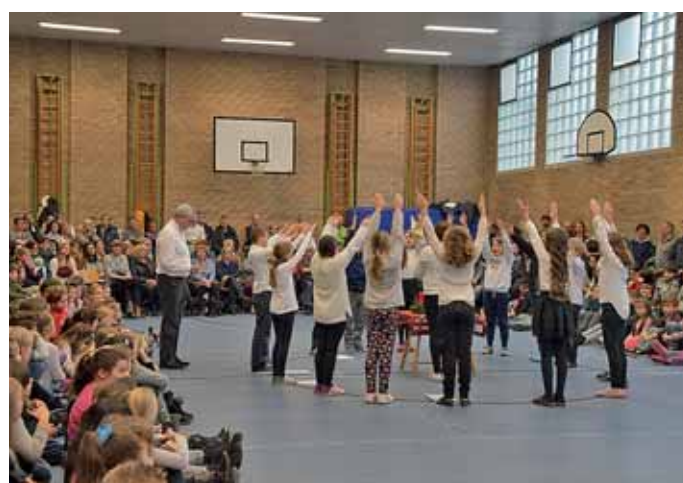
Ob Lieder, Tänze, Gedichte oder Krippenspiel, die Grundschüler in Oberstimm boten den Eltern eine wunderbare vorweihnachtliche Stunde.