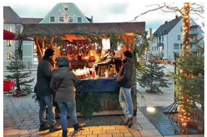
Die Manchinger Vereine schmückten ihre rustikalen Holzhütten festlich.