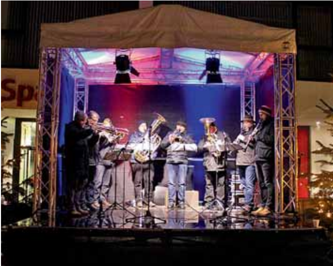
Auch der Auftritt der Mui'gassler mit festlichen Weihnachtsliedern hat mittlerweile Tradition.