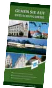
Markt Manching (StM)

Die Erlebniskarte für die nördliche Hallertau bis zur Donau erhalten Sie kostenlos im Rathaus an der Pforte, in der Bibliothek des Marktes Manching und auf unserer Internetseite www.manching.de als Download