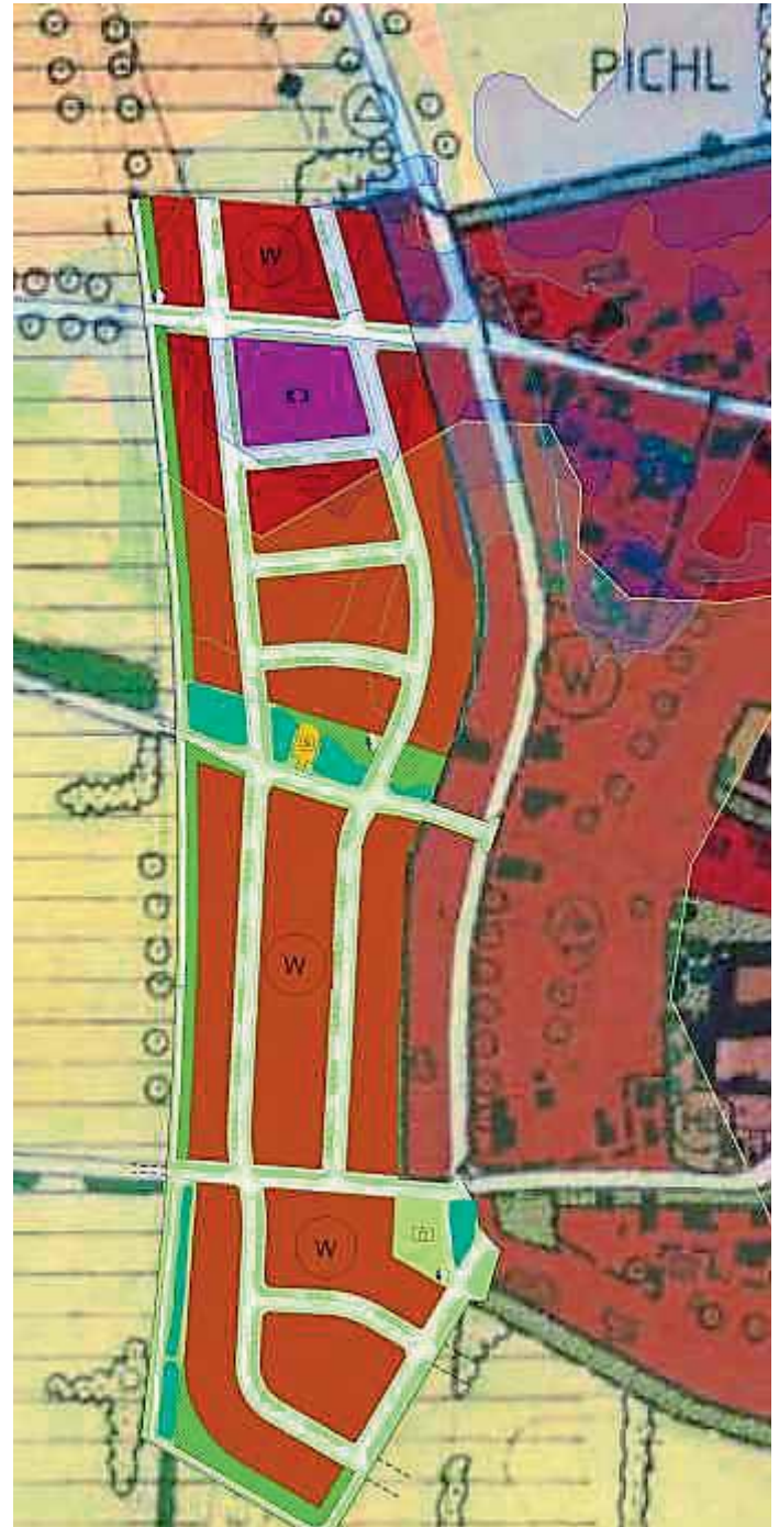
Lageplan zur 17. Änderung des Flächennutzungsplanes