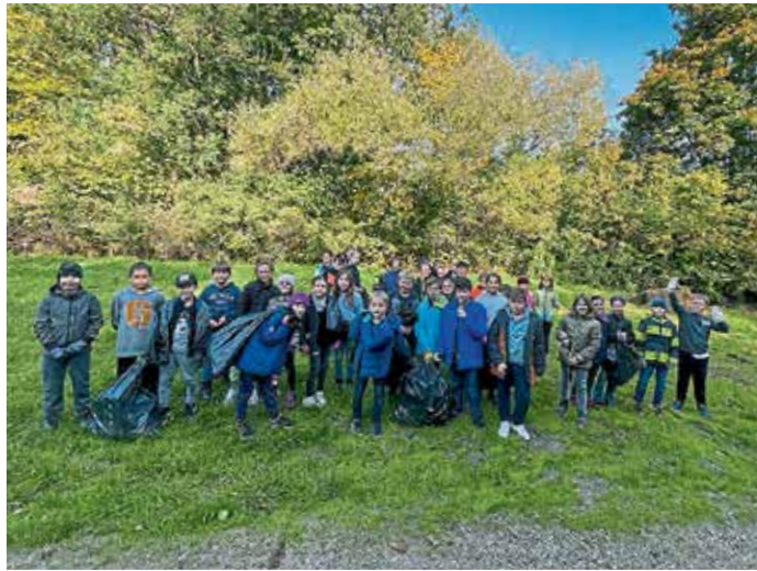
Das Foto zeigt stellvertretend für alle Schülerinnen und Schüler die Klassen 4a und 4c.