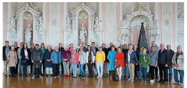
Gruppenfoto der Teilnehmerinnen und Teilnehmer an der Jahresfahrt 2022.