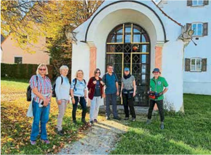
Gruppenbild vor der Erlöserkapelle Biburg