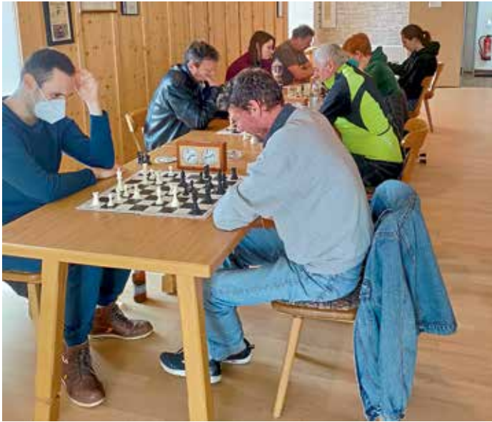
Teilnehmer des Schachturniers vom März 2022