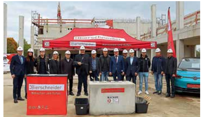
Grundsteinlegung am 14. Oktober 2022

Auto Bierschneider baut am alten Bahnhof der Marktgemeinde Manching ein neues Autohaus. Der Neubau liegt nur wenige Kilometer entfernt vom SEAT/CUPRA-Zentrum Ingolstadt, das bereits seit 2010 zum Familienunternehmen Bierschneider gehört.