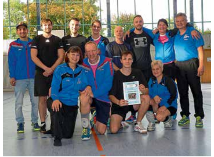
Manchings Mixedmannschaften auf Rang 6 (Manching 2) und 11 (Manching 1) bei der Siegerehrung des Mixedturniers um den Keltencup