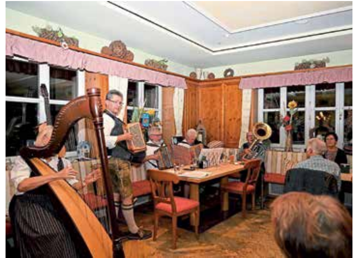
Richtig zünftig und boarisch spielten in Manching die Musikanten auf.