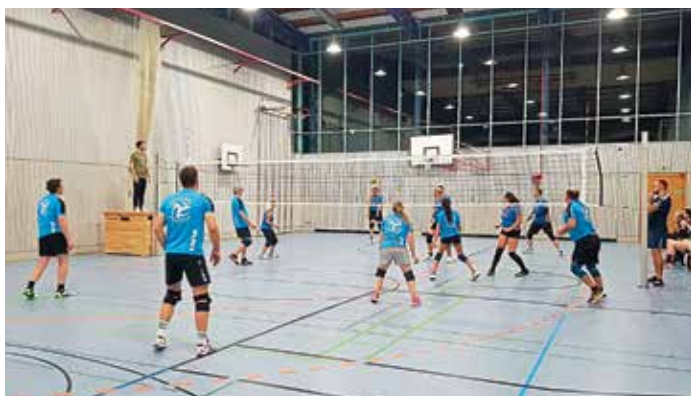
Spielszene MBB Mixed I gegen SV Karlskron