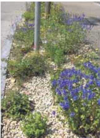
Geplante Staudenanlagen im Wechselfeld Markt Manching