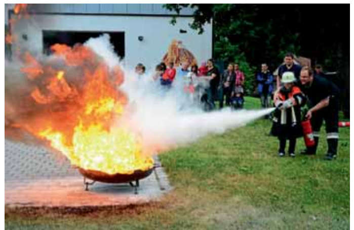
Wie man es nicht macht: brennendes Fett mit Wasser löschen.