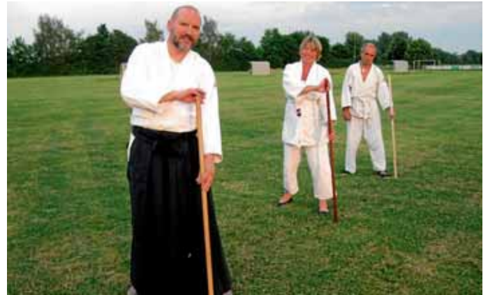
Grundstellung für Jo-Suburi Nr. 5

Alle Teilnehmer genossen dieses besondere Gefühl, das sogar ein paar Mückenstiche vergessen ließ, und trainierten hochkonzentriert, bis sich die Sonne allmählich dem Horizont näherte.