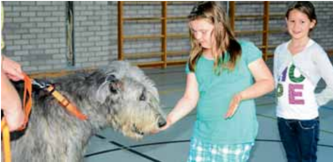
Den richtigen Umgang mit Hunden übten Kinder aller zweiten Klassen in der Turnhalle im Donauefeld.