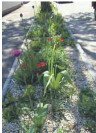
Mit Blumenzwiebeln im Frühjahr Markt Manching