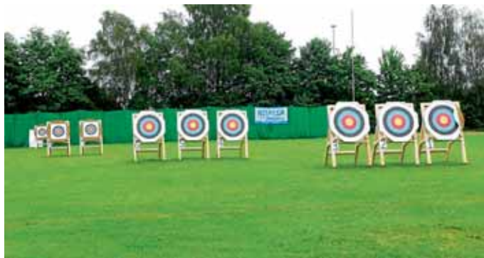
Bogenschießplatz am Sportgelände in Pichl.