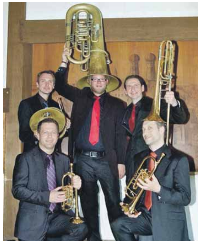
Das Blechbläserquintett SCHUTZBLECH spielt in der Kirche Maria de Victoria.