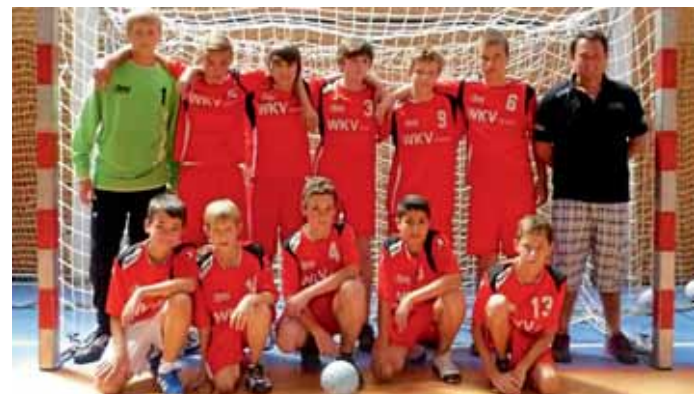
Die erfolgreiche Handball-C-Jugend der MBB SG Manching