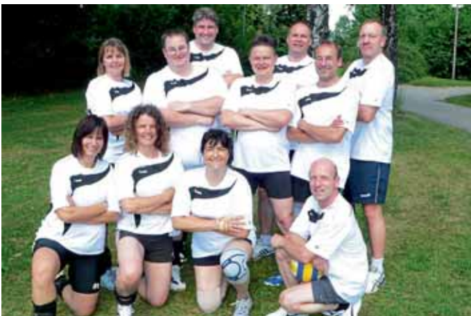
Platz sieben und acht für Manching II (weiße Trikots) und Manching I (grüne Trikots).