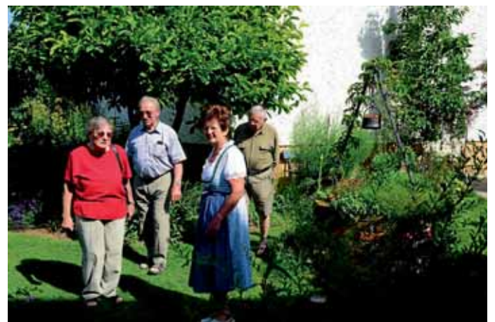
1000 Besucher nutzten die Gelegenheit, um in Oberstimm beim Tag der offenen Gartentür ein mit viel Charme angelegtes Gartenareal zu besichtigen. Max Schmidtnr