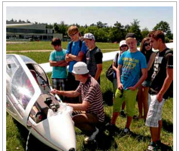
Hoch in die Lüfte ging es für den mutigen Nachwuchs von AmiciO im Juni. Die Sportfluggruppe Manching gewährte unserer Jugend Einblicke in die Kunst des Segelfliegens und zu guter Letzt durften alle Teilnehmer tatsächlich die nähere Umgebung von oben betrachten. Wir bedanken uns ganz herzlich bei den Sportfliegern für diesen perfekt organisierten Tag.