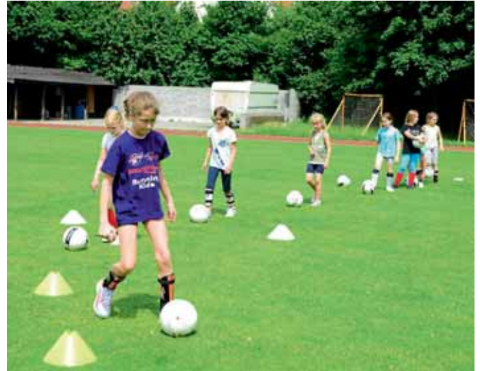
Mädchenfußball der 3. Klassen im Donauefeld.