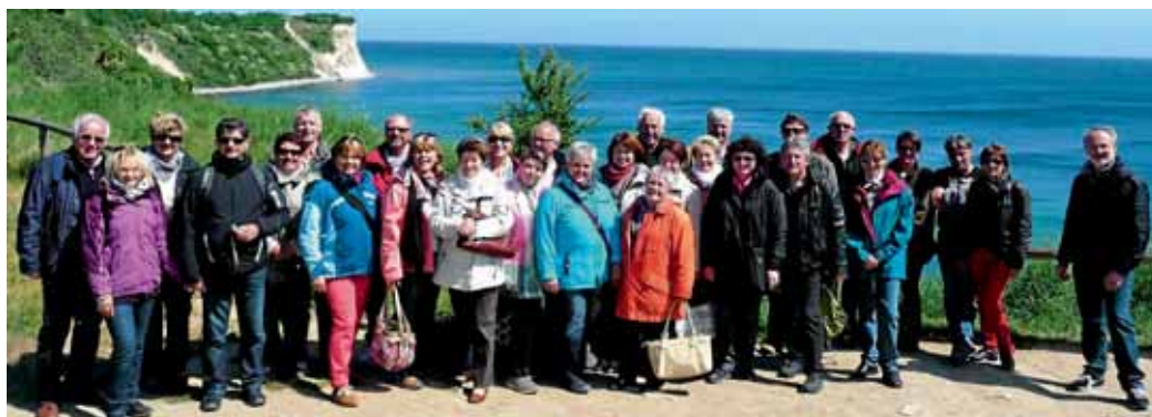
28 Bayern auf Rügen.

Tags darauf führte unsere Reise in die Stadt Stralsund, einem UNESCO Weltkulturerbe. Im Altstadtkern lag unsere Unterkunft für die nächsten zwei Tage, das denkmalgeschützte Hotel Scheelehof. Hier verpassten wir nur knapp eine Begegnung mit Bundeskanzlerin Angela Merkel, die zur gleichen Zeit an einen Gipfeltreffen im Ozeoneum Stralsund teilnahm. Nach dem Rund-