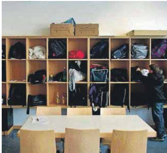
Neue Garderobe im Rahmen der Projektarbeit. Markt Manching

Dabei galt es, den Jugendlichen – unter Einbeziehung ihres gesamten Lebenskontextes und im Zusammenspiel mit den unterschiedlichsten Akteuren – praxisnahe berufliche Schlüsselkompetenzen zu vermitteln. So wurde gehandwerkelt, geschrei-