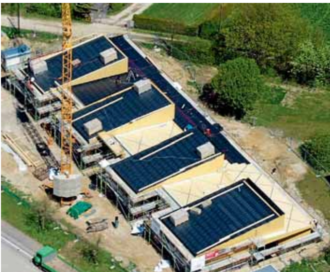
Die neue Kinderkrippe von oben.