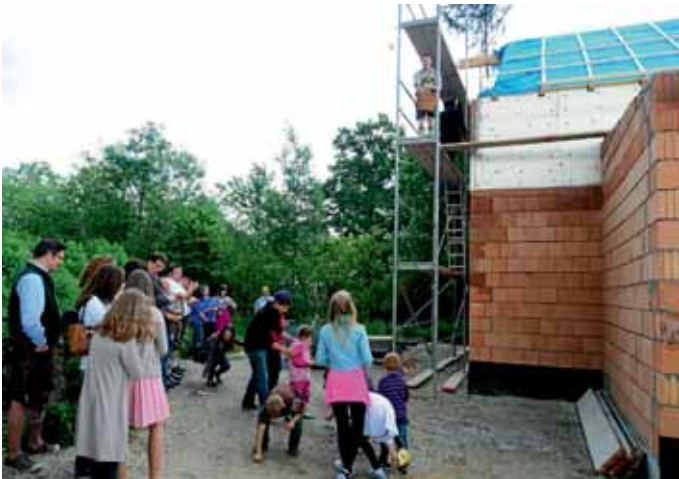
Mit dem Richtfest für das neue Trachtenheim ging für die Trachtler ein Traum in Erfüllung.