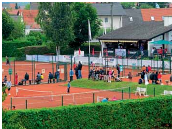
Blick auf die Tennisanlage im Vorwerk T. Hackenjos

Weitere Informationen auf www.mbb-sg-manching-tennis.de oder per E-Mail: info@mbb-sg-manching-tennis.de . T. Hackenjos