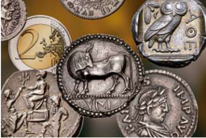
Münzen vermitteln Botschaften, die weit über ihren reinen Zahlwert hinausgehen.