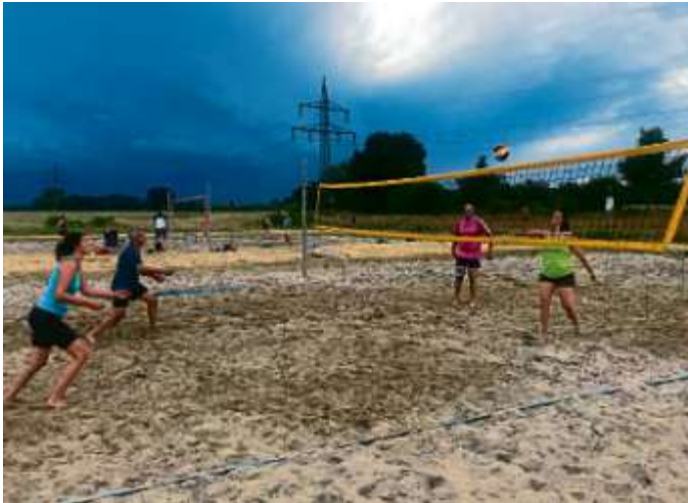
MBB-Beachvolleyballer im Sommertraining

... konnten die Volleyballer der MBB-SG Manching während der vergangenen Wochen im Rahmen ihres Sommertrainings auf den Beachvolleyballplätzen bei der Wake & Grove-Anlage in Nötting genießen.