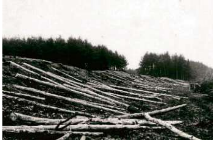
Rodungsarbeiten am Keltenwall von Manching im Rahmen des Flugplatzbaus im Jahr 1938.