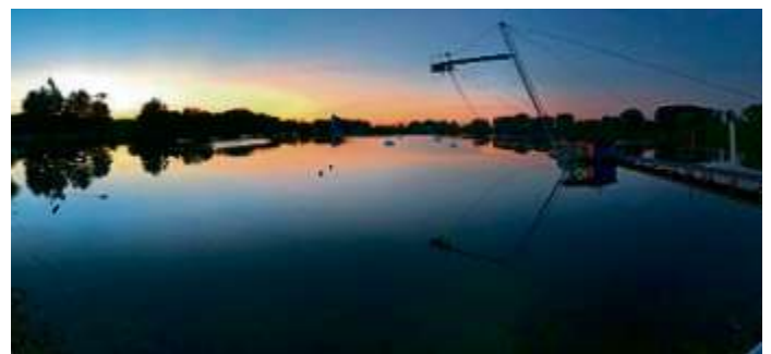
Sonnenuntergang über der Wakeanlage