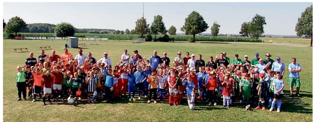
Die Nachwuchsfußballer kämpften beim Jubiläumsturnier der MBB-SG Manching um die Pokale.