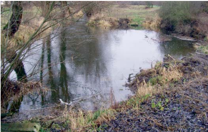
Kleines Biotop entlang des Augrabens.