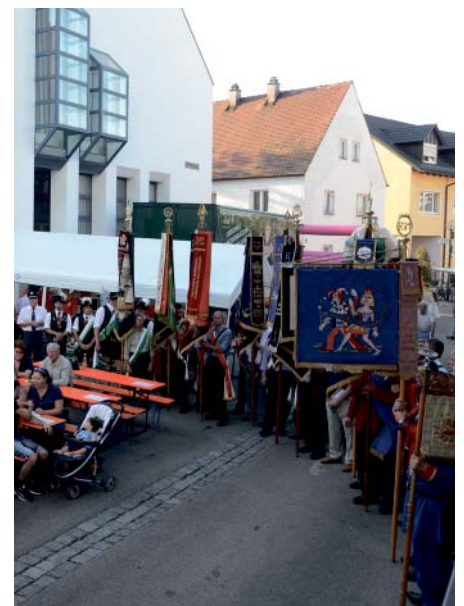
Fahnenabordnungen umrahmten die Bühne auf dem Rathausplatz, auf der die Städtepartnerschaftsurkunde unterzeichnet wurde.

Eurofighter, bis hin zu bunten Lichteffekten – riss die Besucher zu Beifallstürmen hin. Angetrieben von der Musik der Muiggasser Musikanten und in der lauen Sommernacht ging das Fest erst weit nach Mitternacht zu Ende.