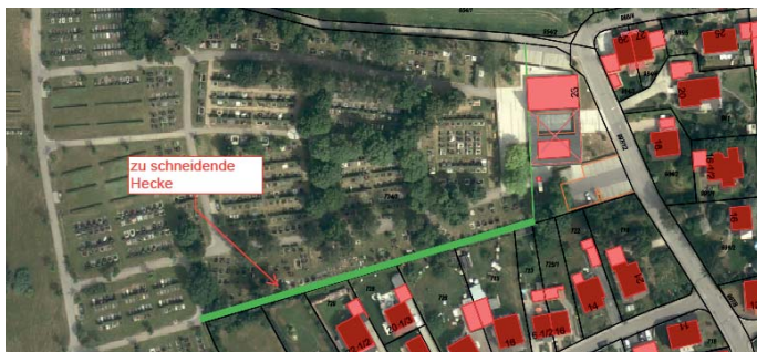
Markt Manching (StH)