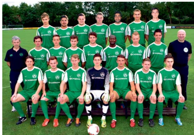
Der Kreisklassenkader des SV Manching in der Saison 2013/2014.