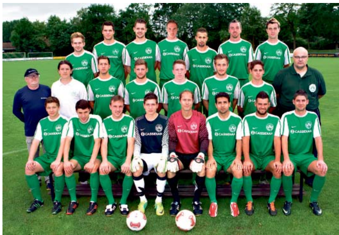
Der Bezirksligakader des SV Manching in der Saison 2013/2014.