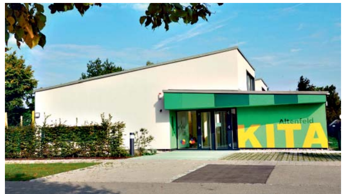
Markt Manching (BoW)

Sparkasse Ingolstadt. Gut für Ingolstadt und die Region.