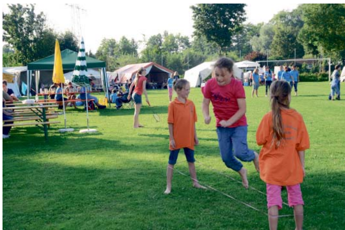
Ein volles Rahmenprogramm wurde den Jugendlichen beim Zeltlager in Niederstimm geboten.