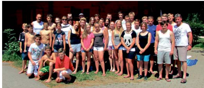
MBB-Handballer im BLSV-Sportcamp Inzell

Neben der ausgezeichneten „Rundumverpflegung“ im Sportdorf widmeten sich die